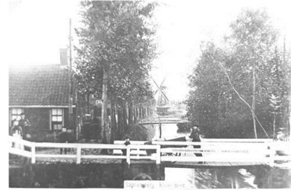
(zicht vanaf Winschoterdiep)

Op de plek van de Kleinemeersterstraat stroomde tot september 1939 het Kleinemeersterdiep. Het was tot de demping verbonden met het Winschoterdiep dat toen nog enthousiast door het hart van o.a. Hoogezand en Sappemeer stroomde. Op de foto zie je vaag dat er vroeger een windwatermolen op de route van het water lag. Deze werd in 1776 gebouwd ter hoogte van de huidige Jan ten Catestraat.