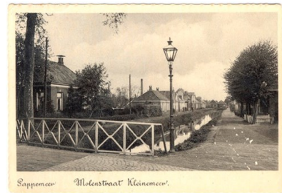
(vanaf Winschoterdiep – ca. 1910)

Op deze foto zie je het zicht vanaf de Middenstraat, voorheen Achterweg, tot aan de watermolen/het gemaal rond 1918. De schoorsteenpijp links achter de huizen behoorde bij kwekerij Van der Schoot.